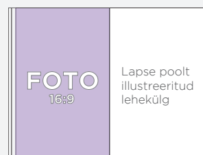
Foto täidab terve lehekülje

Foto asetus vertikaalse fotoraamatu puhul